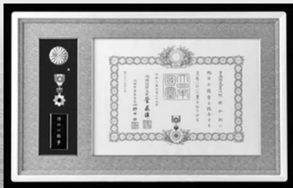
(令和3年4月29日発令 旭日小綬章)

商工会議所における経歴は、平成9年に議員に就任後、平成16年に常議員、平成18年に副会頭、平成26年に会頭に就任し、商工会議所の組織・財政基盤の強化、小規模企業の経営改善、中心市街地の活性化、若手経営者の育成など、地域総合経済団体としての商工会議所の使命を深く認識し、確固たる信念に基づき、誠意と情熱をもって商工会議所活動の伸展と円滑な運営にあたり、商工会議所の社会的信用と地位向上に献身努力を重ねてきた。